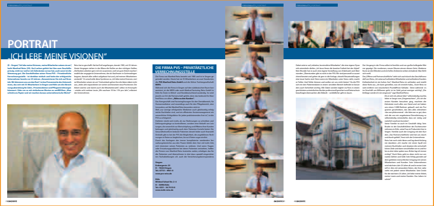
Akzent Magazin, Februar 2010

Unser Jubiläumsjahr wird auch von den Medien wahrgenommen und gewürdigt, was uns natürlich stolz macht. Die schönsten Berichte wollen wir Ihnen natürlich nicht vorenthalten: