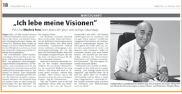
Südkurier, 11. Januar 2010