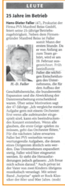
Südkurier, Januar 2010