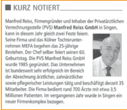
Wirtschaft im Südwesten, Februar 2010