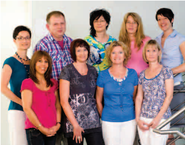
Unser Team hat für alle Fragen ein offenes Ohr